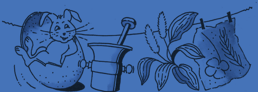
Illustration: Maja Bläsi

Aktuelle Informationen und weitere Anlässe unter museumblumenstein.ch